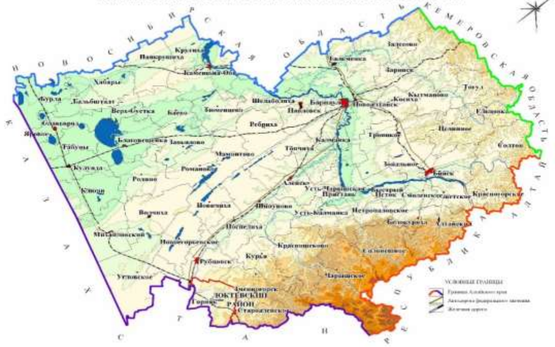
СХЕМА РАЗМЕЩЕНИЯ МУНИЦИПАЛЬНОГО ОБРАЗОВАНИЯ ЛОКТЕВСКИЙ РАЙОН В СТРУКТУРЕ АЛТАЙСКОГО КРАЯ

Поселение расположено в 25 км от города Горняка и ближайшей железнодорожной станции. До краевого центра г.Барнаула удаленность составляет 380км, связь с которым осуществляется по железной дороге и по дороге с асфальто-бетонным покрытием.