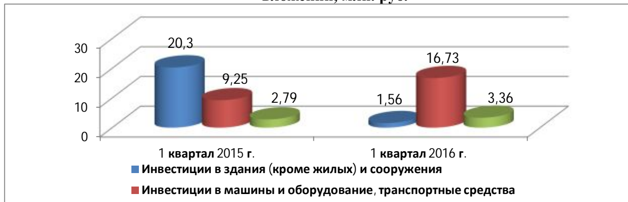
Объем инвестиций в основной капитал крупных и средних организаций по видам вложений, млн. руб.

Кризисные явления привели к сокращению инвестиций в бюджетные проекты.